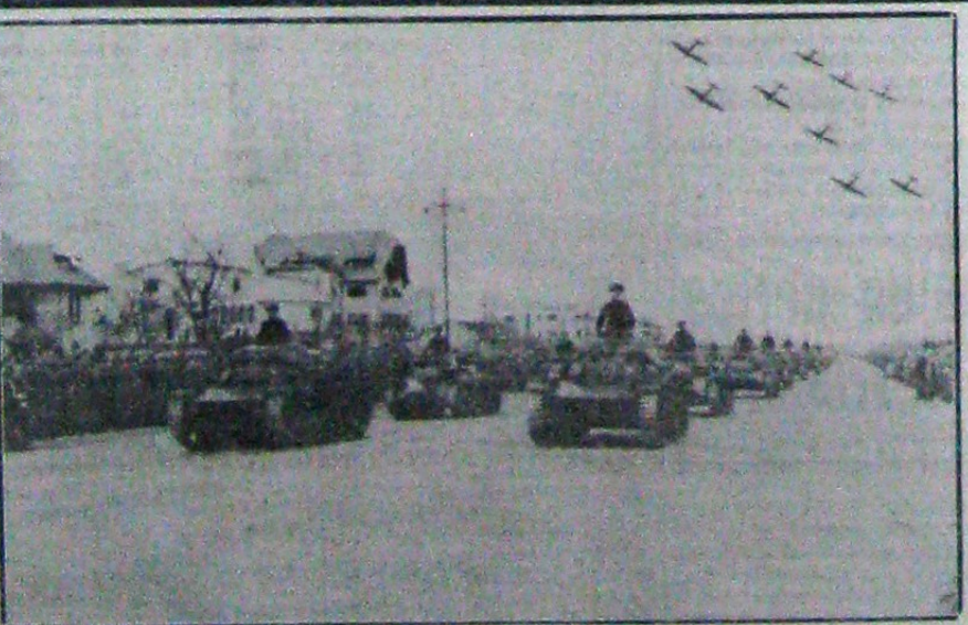
Parada militară din Capitală Defilarea tankurilor și a avioanelor

Avioane inamice au aruncat bombe în regiunea Cassala, provocând printre populație doi morți și patru răniți: un avion inamic a fost doborât de artileria antiaeriană. Alte incursiuni aeriene au avut loc asupra localităților: Burao, unde două femei au fost rănite, Assab și Mehemma unde se numără trei morți și 17 răniți.